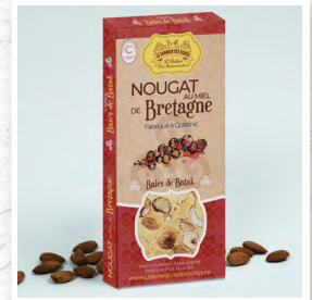
Les Baies de Batak