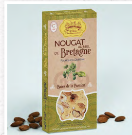
Les Baies de la Passion