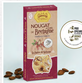
Le Poivre de Sichuan