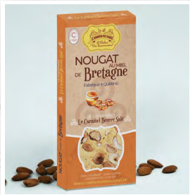
Le Caramel Beurre Salé