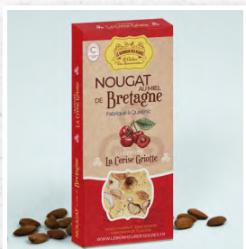
La Cerise Griotte