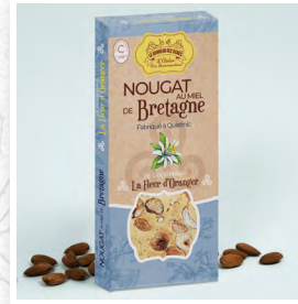
La Fleur d'Oranger