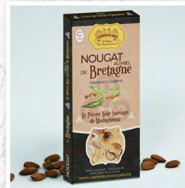
Le Poivre Noir Sauvage de Madagascar