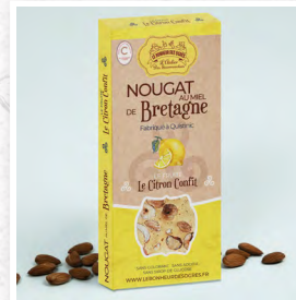
Le Citron Confit