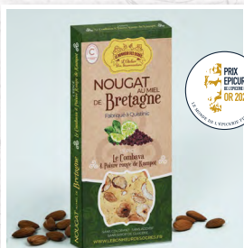
Le Combava & Poivre Rouge de Kampot