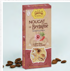
Les Baies Roses & Roses de Provins